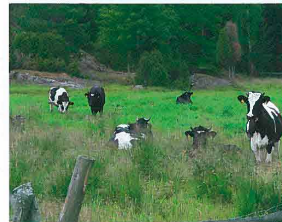
Karjaa laitumella Skärlandetin maisemanhoitoalueella. Tammisaari, Uusimaa.

Maisema-alueiden inventointia ohjaa ympäristöministeriön asettama työryhmä, jossa on edustettuna ympäristöministeriö,