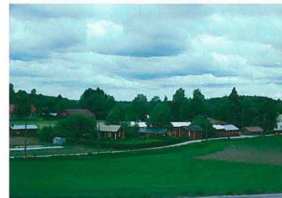
Maalaiskylä Auttoisen ja Vesijaon arvokkaalla maisema-alueella. Padasjoki, Päijät-Häme.

Valtakunnallisen inventoinnin jälkeen osassa maakuntia on tehty myös maakun-