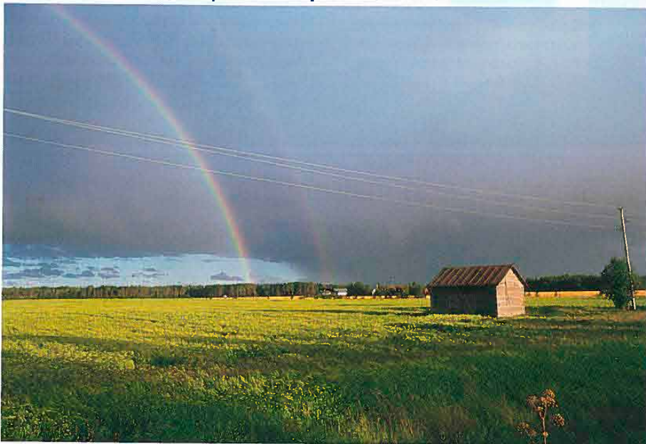
Viljelymaisemaa Keski-Pohjanmaalla.