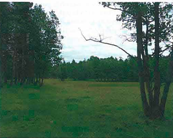
Laidunaluetta Skärlandetin maisemanhoito-alueella. Tammisaari, Uusimaa.

nallisesti arvokkaiden maisema-alueiden inventointeja. Maakunnallisesti arvokkaat alueet eivät välttämättä ole ihan yhtä hyvin säilyneitä, tai maisemiltaan yhtä monipuolisia, kuin valtakunnallisesti arvokkaat, mutta ovat silti maakunnan tasolla edustavia.